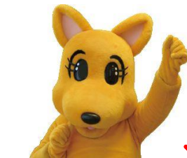
クレオ大阪マスコットキャラクター ジャンプちゃん