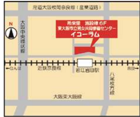
（近鉄奈良線 若江岩田駅前 希来里ビル施設棟6F）

休館日：月曜日（祝日・振替休日の場合は開館し、翌平日に休館） 及び年末年始（12月29日から1月3日）